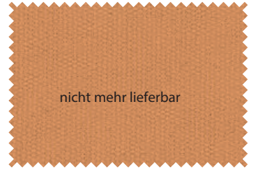
155 Bitter Orange