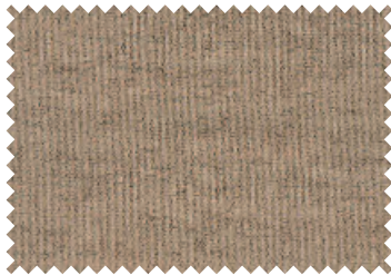
911 Beige meliert