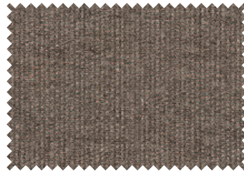
912 Braun meliert