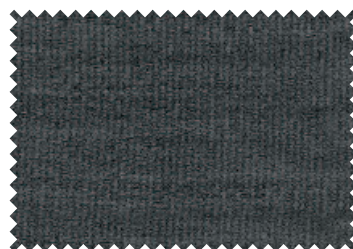
909 Anthrazit meliert