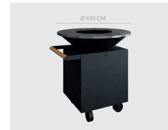
OFYR CLASSIC BLACK 100 PRO