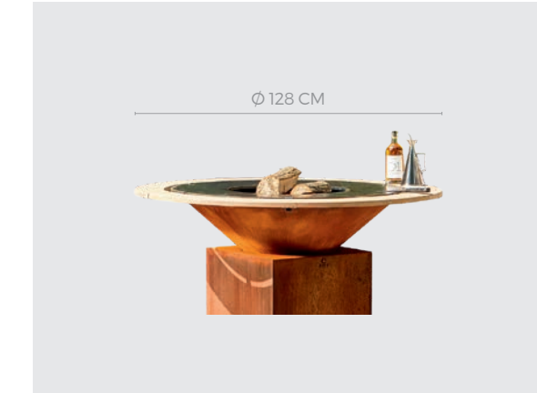
OFYR FIRE GUARD RING 100