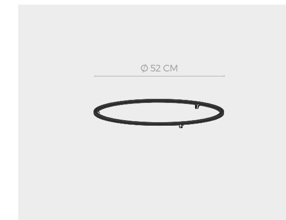
OFYR FOOD BUMPER 100