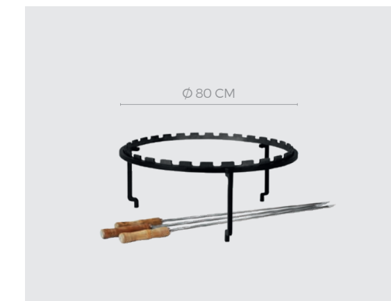
OFYR HORIZONTAL SKEWERS SET XL