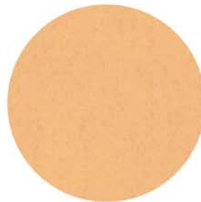
M 9875 creme ähnlich RAL 1015 Einfassband 11 beige