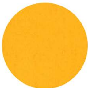
M 9526 maisgelb ähnlich RAL 1023 Einfassband 32 gelb