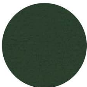
M 9710 moosgrün ähnlich RAL 6005 Einfassband 95 dunkelgrün