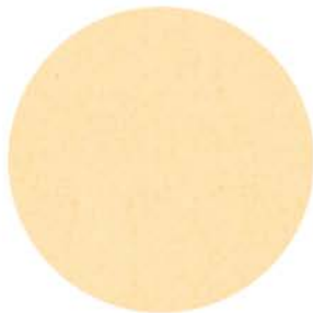
M 9823 elfenbein ähnlich RAL 1015 Einfassband 20 elfenbein