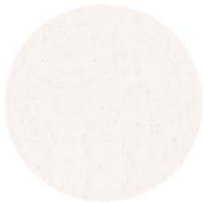
M 9577 weiß ähnlich RAL 9010 Einfassband 00 weiß