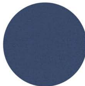
M 9793 mittelblau ähnlich RAL 5005 Einfassband 63 mittelblau