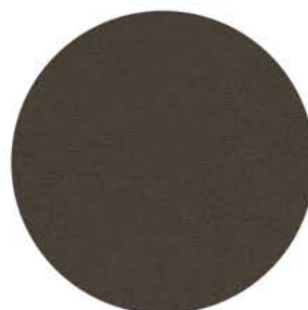
M 9654 graphitgrau ähnlich RAL 7024 Einfassband 97 basaltgrau