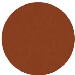
M 9878 terrakotta ähnlich RAL 8004 Einfassband 83 rostrot