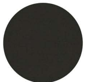
M 9853 schwarz ähnlich RAL 9004 Einfassband 19 schwarz