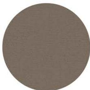
M 9653 grau ähnlich RAL 7004 Einfassband 18 silber