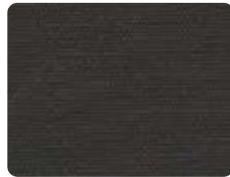
Grau meliert 25986